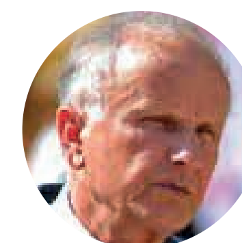
PROF. GRZEGORZ KOŁODKO